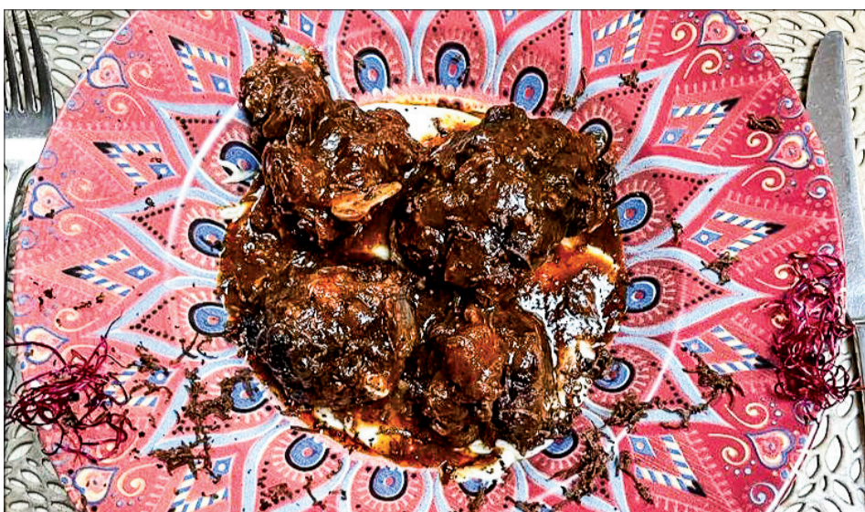
Rabo de toro al chocolate con puré trufado.

en este mismo edificio que ahora es el Villa de Brihuega. Una anécdota que sin duda hace emblemática esta ubicación.