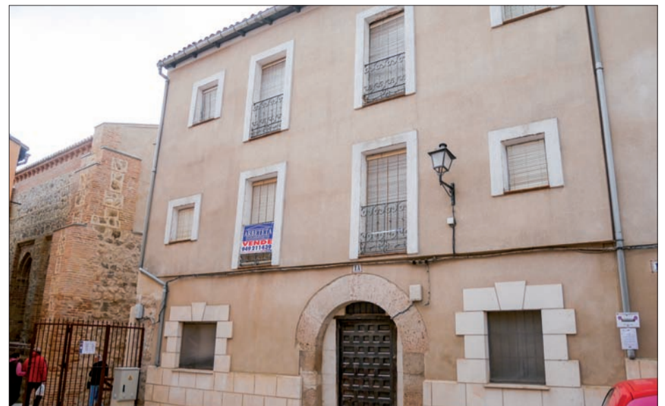
El inmueble será remodelado para acoger el Centro de Innovación.

Por otro lado, el Plan de Sostenibilidad Turística en Destino ‘Alcarria Literaria’ también engloba la rehabilitación del Convento de San José como Museo de la Lavanda y el Perfume con una inversión de 710.000 euros, de los que durante el año 2024 está prevista una ejecución de 540.651 euros, es decir, el 76% de esta actuación. Una vez rehabilitado el edificio histórico, se realizará su musealización, prevista ya para el año 2025, con un presupuesto de 300.000 euros más. El objetivo no es otro que impulsar el turismo de sensaciones y ahondar en los conocimientos que tengan que ver con dicha planta de color violeta. Las obras de restauración discurrirán por los salones que rodean la planta baja del claustro, el propio claustro