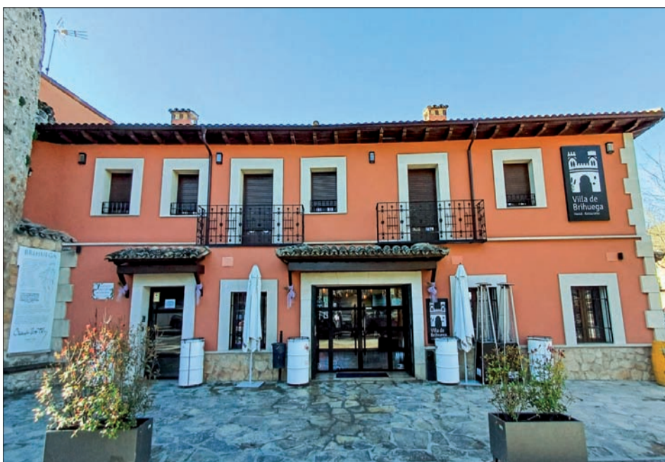
Exterior del Hostal-Restaurante Villa de Brihuega.