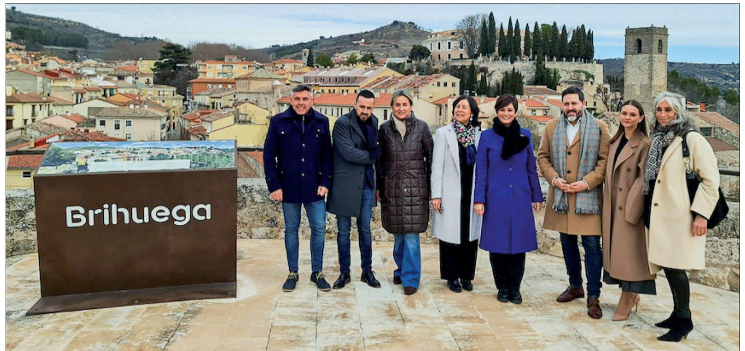
El proyecto ha sido financiado gracias al programa 1,5% Cultural del MIVAU.

La restauración en el Castillo de Brihuega se ha ejecutado con cargo al Programa 1,5% Cultural, que depende del Ministerio de Vivienda y Agenda Urbana (MIVAU), y es el principal instrumento de la Administración General del Estado para garantizar la conservación del patrimonio histórico, cultural y artístico de España. "El Ministerio aporta 466.000 euros —el 66% de este proyecto de restauración—, que cuenta con un presupuesto total de 706.000 euros para la recuperación de patrimonio histórico", según recordó la ministra. Con financiación del 1,5% Cultural también se inició la restauración de la antigua Fábrica de Paños, tras adquirirla el Ayuntamiento-