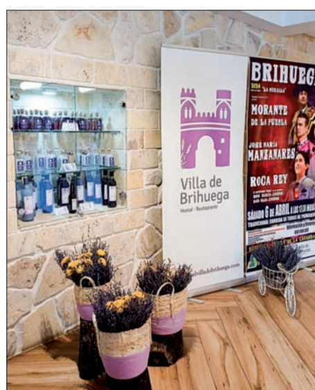
Recepción Hostal Villa de Brihuega.

Para solicitar información o realizar reservas en el Hostal-Restaurante Villa de Brihuega está a disposición de los clientes el teléfono 949 280 300 y el correo electrónico info@hostalvilladebrihuega.com . Además, en la página web www.hostalvilladebrihuega.com se puede consultar toda la propuesta gastronómica y realizar reserva de habitaciones.