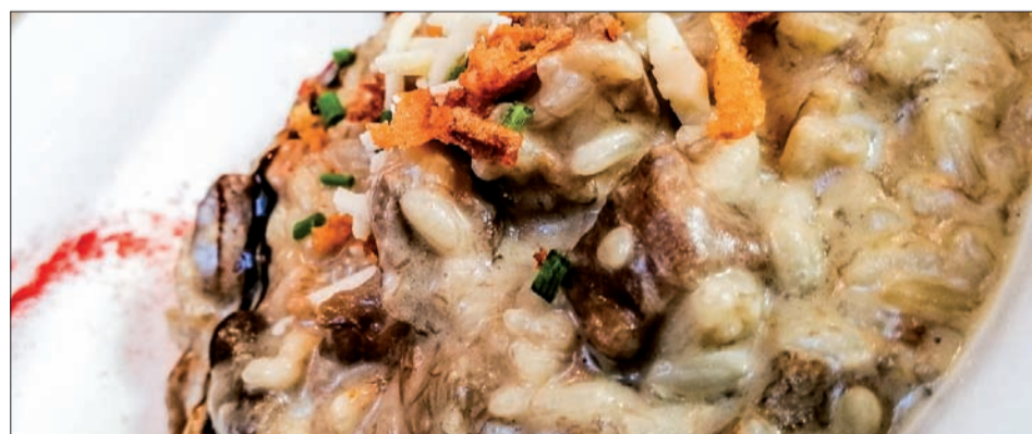
Risotto de setas y parmesano.