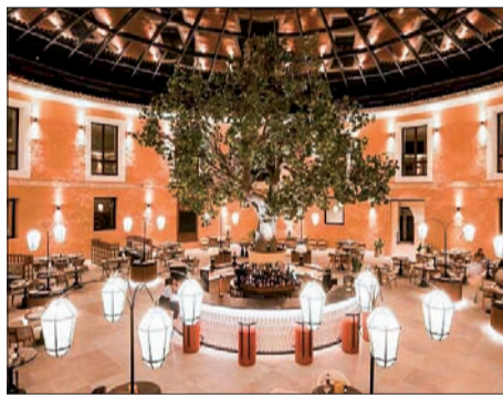
Encanto, confort y lujo en el corazón de La Alcarria.

centro de la península que, además, está declarado como Bien de Interés Cultural desde 2002.