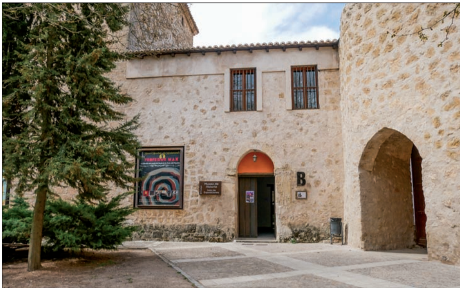
El convento de San José albergará el Museo de la Lavanda.

realizando su trabajo de manera telemática y a través de internet con total flexibilidad y libertad. “Es una nueva perspectiva de hacer turismo que queremos expresar y para ello proponemos este espacio con acceso a internet”, admite el alcalde de Brihuega. La creación de este emplazamiento busca, en definitiva, crear sinergias entre la comunidad local y estos viajeros modernos, fomentando una colaboración mutuamente beneficiosa que enriquezca tanto la economía local como la experiencia de los visitantes. “Considero que la iglesia y el jardín de San Simón son espacios creativos y de intercambio, que ayudarán a estos viajeros a desarrollar sus ideas y proyectos”, apunta Viejo.