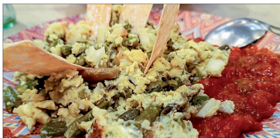
Revuelto de trigo y ajorriero.