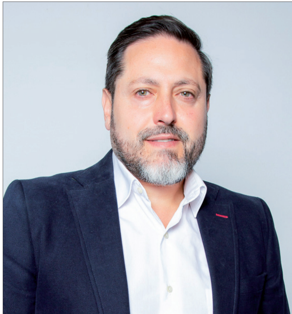
Las sinergias en todas las áreas impulsan el desarrollo del municipio.

R No se trata de un programa como tal. Se está llevando a cabo una estrategia definida con varios hitos importantes. El primero de ellos implica una reunión con la viceconsejera de Cultura para dar seguimiento, por ejemplo, al expediente para la declaración de Bien de Interés Cultural del encierro, solicitada hace tiempo por el Consistorio. Este en-